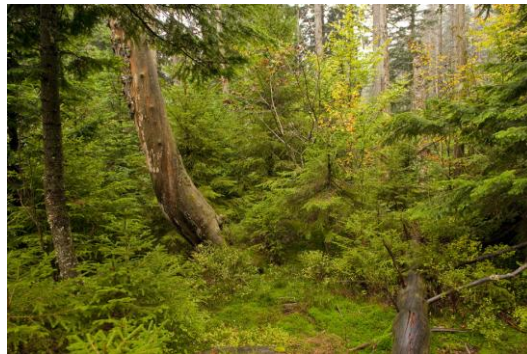
Im Bannwald Wilder See, Nordschwarzwald, ältester Bannwald in Baden-Württemberg - der Urwald von morgen!

len beispielsweise die Nationalparks, die wenigen Bannwaldflächen in Baden-Württemberg (0,5%) oder die Naturwaldreservate in Bayern. Jahrhundertlange intensive Nutzung hat die natürlichen Wälder in Deutschland überwiegend in naturferne Forste verwandelt. Die Umtriebszeiten für Holz in Wirtschaftswäldern (Wuchszeit bis zur Abertung) werden aufgrund steigender Nachfrage nach Holz immer kürzer. Diese jungen Forste sind im Gegensatz zu Urwäldern nicht in der Lage große Mengen an CO 2 zu speichern und damit einen Beitrag zum Klimaschutz zu leisten, viele walddtypische Tier- und Pflanzenarten finden dort keine Heimat mehr.