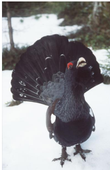
Ein balzender Auerhuhn

Ökonomisch zahlt sich die Einrichtung eines Nationalparks somit im Wesentlichen in den angrenzenden Naturparkgemeinden aus, da im Nationalpark selbst keine Hotels und Restaurants entstehen werden. Die Bedeutung der viel größeren Naturparkregion steigt mit einem weltweit bekannten Premium-Prädikat „Nationalpark“ und verleiht dem gesamten Nordschwarzwald ein renommiertes Alleinstellungsmerkmal. Im Doppel wirken Nationalpark und Naturpark besonders erfolgreich – das zeigen Beispiele in anderen Bundesländern 10 .