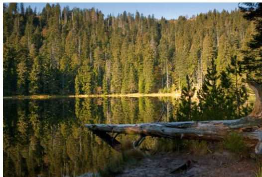
Der Wilde See im gleichnamigen Bannwald

In einem Nationalpark wird bewusst auf die Nutzung von Holz verzichtet, da die ungestörte natürliche Entwicklung Arten neuen Lebensraum eröffnet, der im Wirtschaftswald nicht mehr besteht. Der jährliche Ausfall an Nutzholz im Schwarzwald wäre mit vmtl. 30.000 bis 50.000 Festmeter vergleichsweise gering und entspricht in etwa dem Holzdurchsatz eines mittleren Sägewerks im Schwarzwald in 2 Monaten oder 0,5% des jährlichen Gesamtein-schlags im Land. All das wird den Holzmarkt in Baden-Württemberg mengenmäßig oder durch höhere Holzpreise nicht sonderlich beeinflussen.